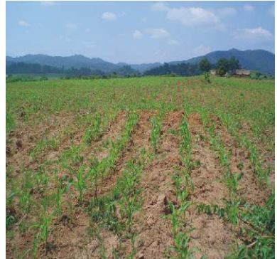
Ngô lai trồng hàng đơn

Sau khi gieo ngô xong thì tiến hành trồng các hàng cỏ. Tại mép trên của các hàng cỏ, rác khô đã gom lại, dùng cuốc hay cây rạch thành rãnh sâu 15cm, rộng 20cm. Sau đó cho phân bón lót vào rãnh và đặt hom cỏ vào rãnh với khoảng cách