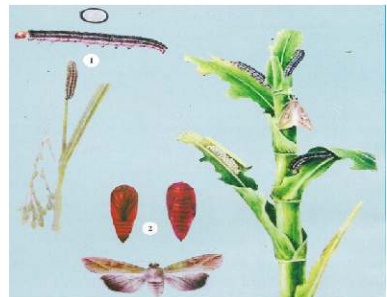
Sâu cắn lá ngô