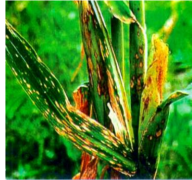
Bệnh gỉ sắt ở ngô