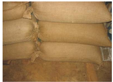
Bảo quản ngô hạt trong kho