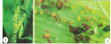
Rệp gây hại ngô