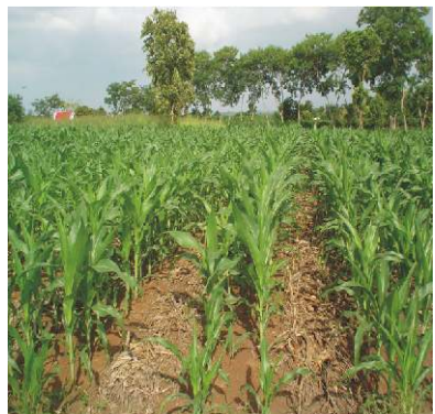
Ngô lai trồng hàng kép