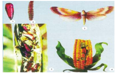
Sâu đục thân, đục bắp