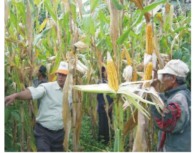
Thu hoạch ngô

Đóng ngô hạt trong bao đay và chất thành từng đống trên giá cách mặt đất 10 đến 15 cm, không nên để bao quá sát tường hay những nơi dễ bị ẩm ướt.